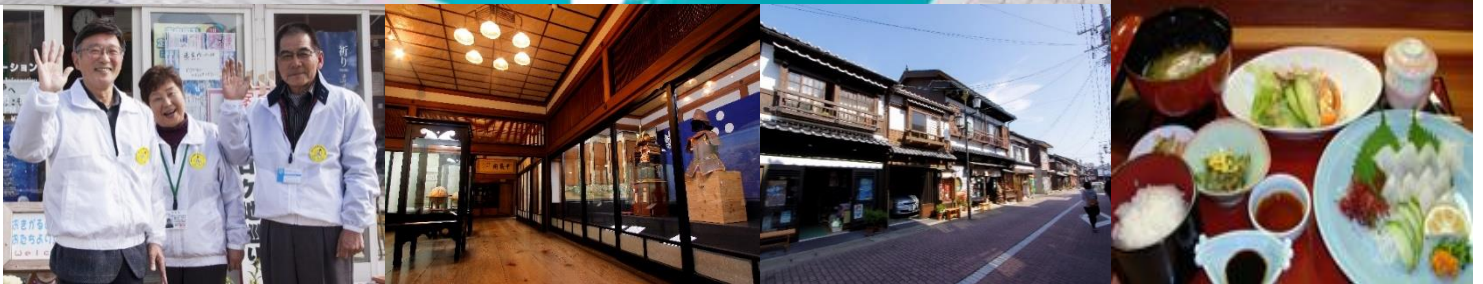
写真は全てイメージです。